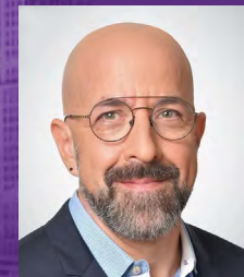
פרופ' ישי בלנק דקאן הפקולטה