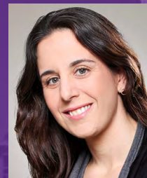
פרופ' תמי קריכלי כץ מנהלת אקדמית של תכנית ת"א נורת'ווסטרן